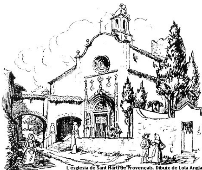
L'església de Sant Martí de Provençals. Dibuix de Lola Anglada.

Torrelles de Llobregat (el Baix Llobregat)