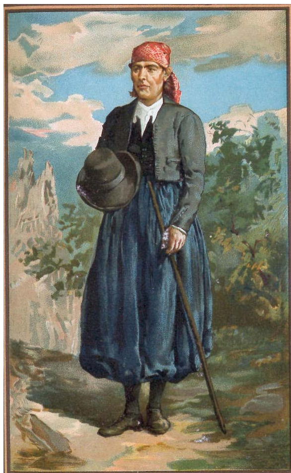
Un pagès mallorquí endiumenjat