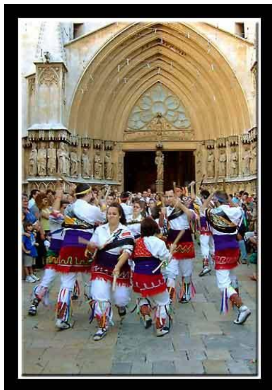
Ball de Bastons per Santa Tecla (Tarragona)

Es dona els cas que l'Emperador va prohibir la celebració d'aquestes festes perquè les considerava bàrbares i no concordaven amb els criteris humanitaris actuals. La collita va ser desastrosa i davant les protestes van creure prudent tornar a autoritzar les danses de nou.