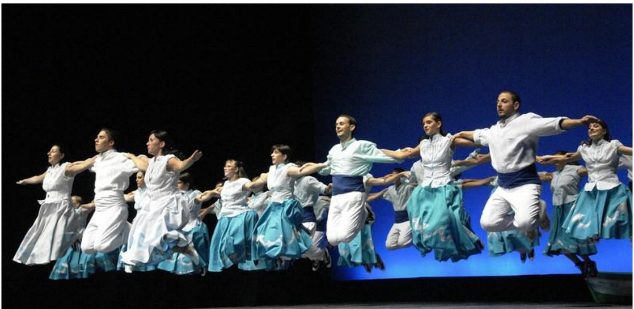
Esbart Montgrí de Torroella de Montgrí