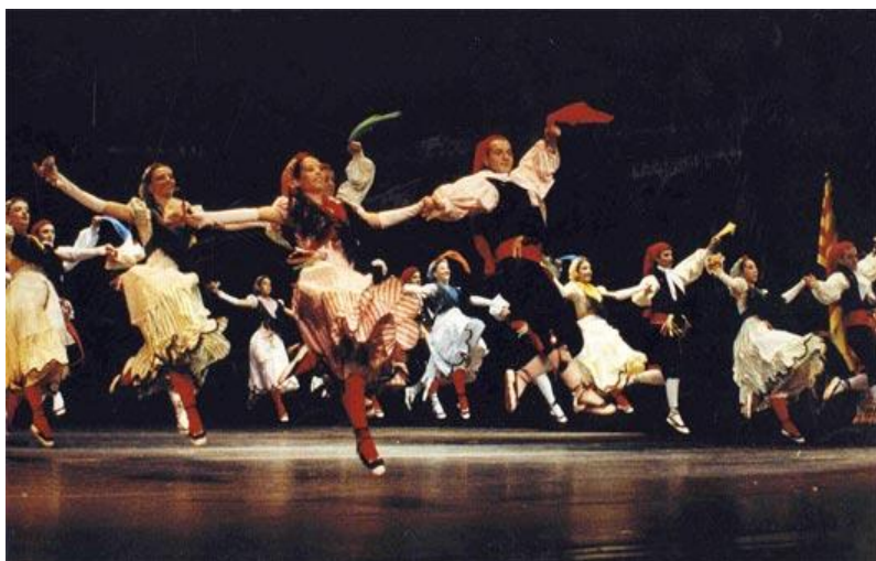
Ball de Gitanes de Rubí per l'Esbart Dansaire de Rubí