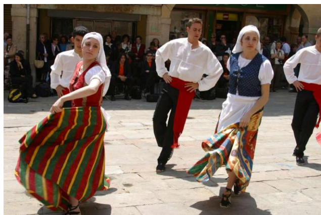
Ball de l'Eixida de Tàrrega