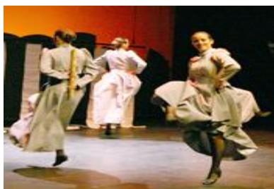
Esbart Egarenc de Terrassa

En fires i festes majors, tant se n'atipen un com dos. Pagès de fira i mercat, mai no serà acabat. Cadascú parla de la fira, segons li va. El que ho guanya en molts mercats, ho perd en una fira. El qui va a fira sense diners, és un embarrascarrers