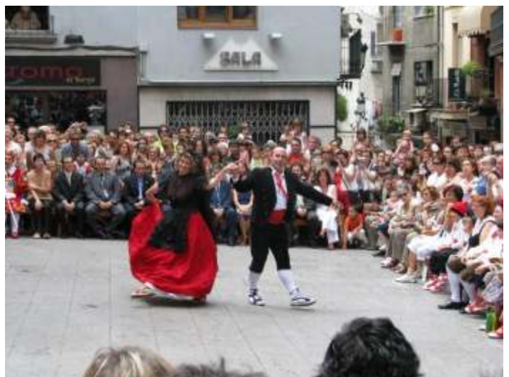
Ballet de Déu de Berga a la plaça de Sant Joan