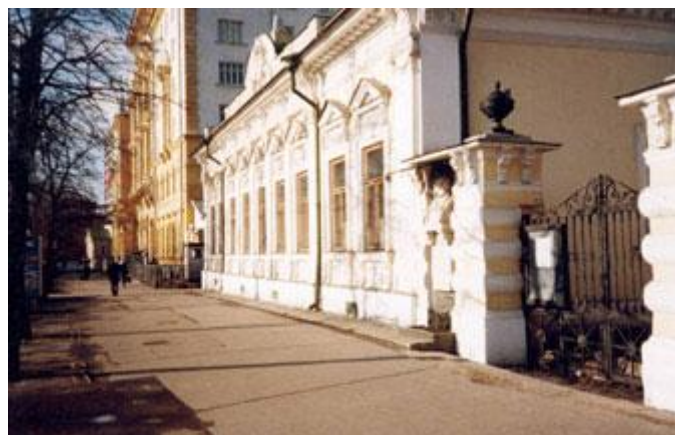
La casa-museu del cantant a Moscou