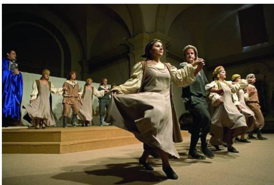
Representació del ball del Sant Crist.