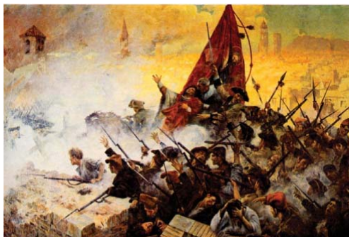
L'Onze de Setembre de 1714, (Pintura d'Antoni Estruch - 1909)

Volem compartir aquesta reivindicació amb totes les persones que viuen a Catalunya, vinguin d'on vinguin. Només si tenim més capacitat per decidir com volem que sigui el nostre país podrem construir-lo més just, plural, solidari, integrador i sostenible.