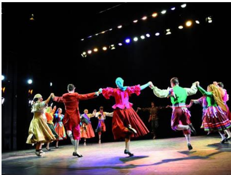
L'Esbart Joaquim Ruyra de Blanes a l'Auditori de la Diputació de Màlaga

Més informació : http://www.codietic.cat/index.php?option=com_content&view=article&id=221:lleis