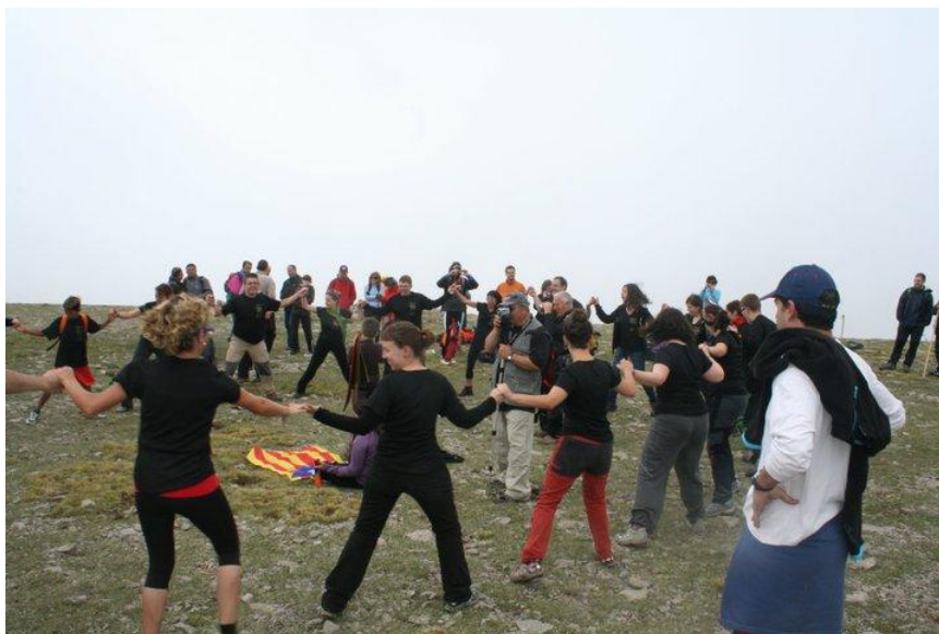
Dansant al cim berguedà del Comabona, de 2.547 metres

Era un dels actes inclosos en el programa de celebracions de les sis dècades d'existència d'aquesta entitat. La jornada es va iniciar de bon matí. Les persones que van voler participar en l'excursió van sortir de Bagà amb els seus cotxes per anar fins a l'indret conegut amb el nom de les Bassotes. Aquest va ser el punt d'inici de la caminada fins a dalt del cim. Abans es va fer una parada per esmorzar. Un cop dalt de la muntanya es va dansar el ball cerdà, la bolangera de Bagà i la part final del ball de gitanes, el galop. Fonts de l'organització han explicat que a la part final del ball, de mica en mica, es va anar aixecant la boira en aquest indret. Després de ballar les danses, els excursionistes van emprendre el camí de tornada. La comitiva va dinar al coll de la Bauma. Per molts anys !