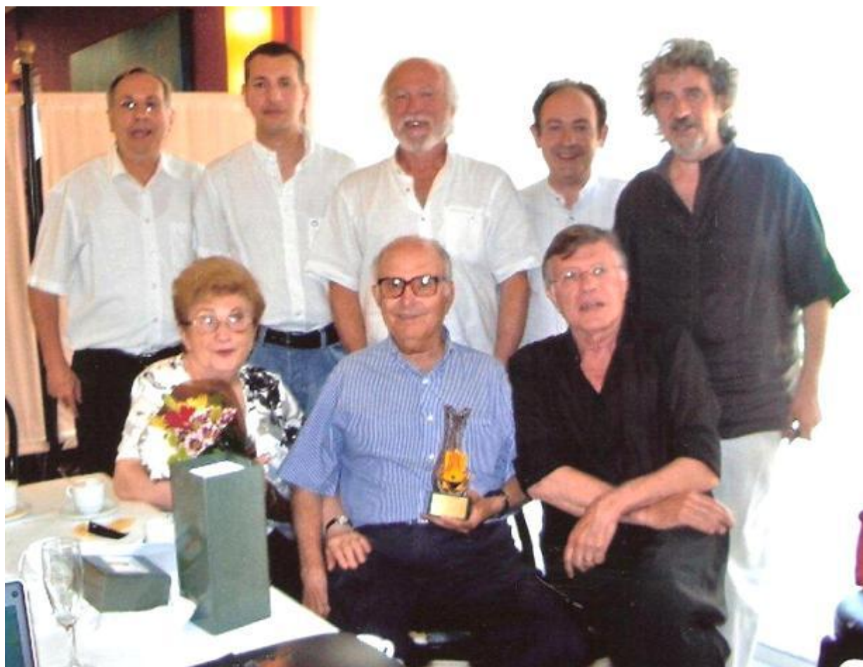
Una part del Consell Directiu

Des que vaig deixar el Consell Directiu, després de tants anys de formar-ne part, totes les Juntes, fins avui mateix, han tingut la gentilesa d'honorar-me amb una confiança que jo m'esforço a continuar mereixent, i m'envien fotocòpia de les actes de les seves reunions (a partir d'ara s'alleujarà el seu esforç, perquè me les podran fer arribar per correu electrònic), en el context de les quals puc anar vivint el batec de la Institució i puc adonar-me de totes les dificultats que hi segueixen havent per a anar desenvolupant la direcció de l'entitat. Que n'hi ha. Més de les que de fora estant puguin semblar aparents. A través de la seva lectura m'és permès de copsar que hi segueixen havent les mateixes pulsacions positives, però que les que no ho són tant tampoc no minven. Darrerament en una d'aquestes actes s'hi contemplava la proposta de cercar persones (si pot ser joves, diu. Què més voldríem?), per a cobrir llocs a la Junta Directiva. La meua pretensió, avui, és ocupar-me d'aquest aspecte.